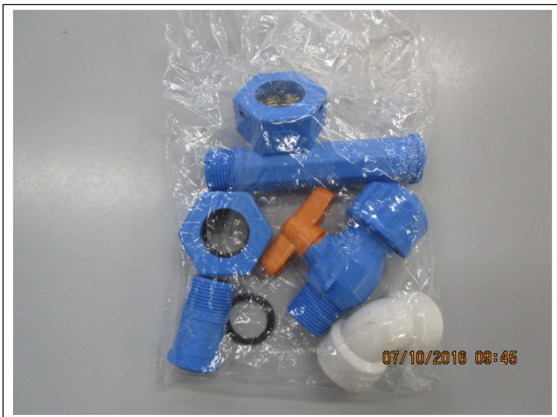
Figura 1: imagem do modelo do kit como deve ser embalado

Obs.: Os kits deverão vir em uma única embalagem contendo todos os itens acima descritos.