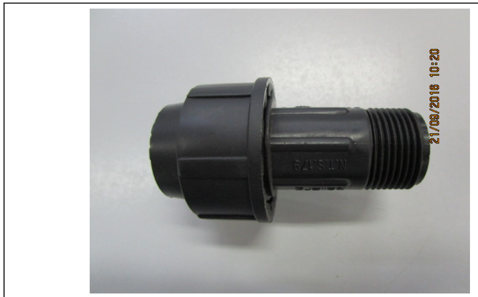
Figura 6: ADAPTADOR PEAD 20X3/4" PN16