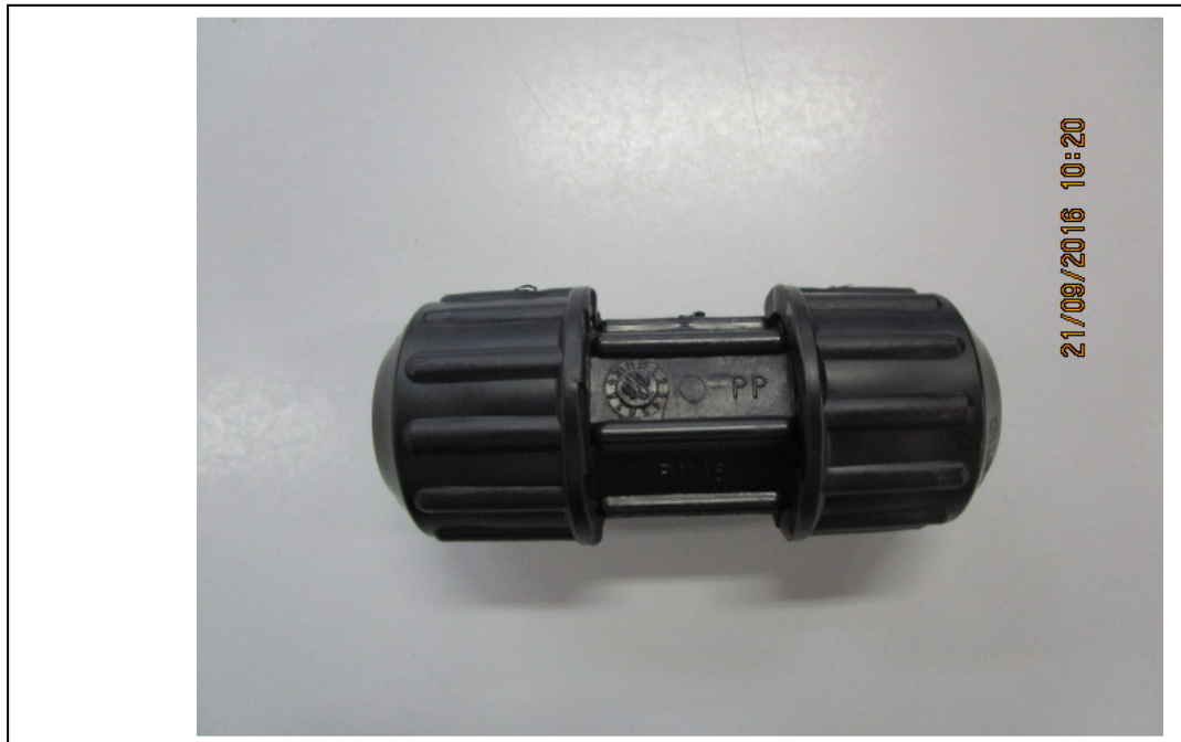
Figura 3: UNIÃO PEAD DN20MM NTS 179