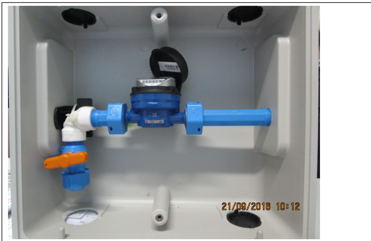
Figura 2: imagem do modelo do kit instalado dentro da caixa

LOCAL: Pça. Dr. José Sacramento e Silva, n.º 50, Centro - Porto Feliz /SP