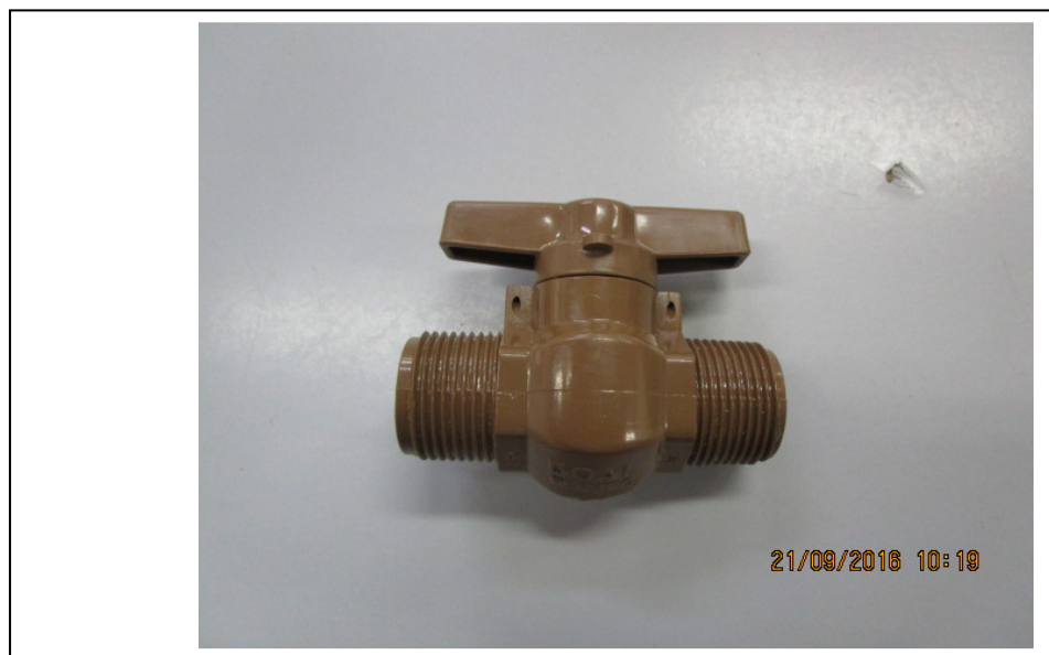
Figura 7: REGISTRO ESFERA PVC MACHO X MACHO ¾"X3/4"