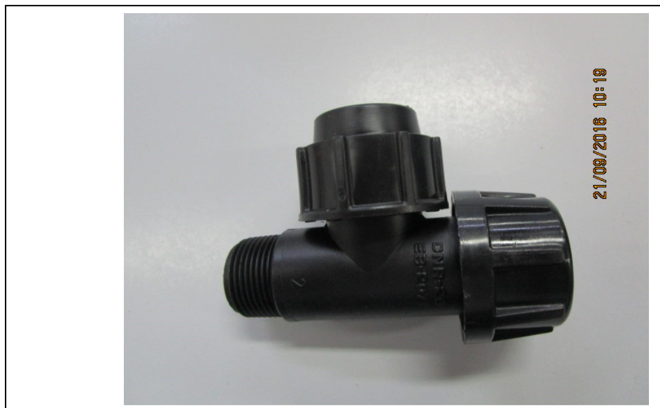
Figura 5: DERIVAÇÃO BROCA PEAD PN10 ¾"X20MM