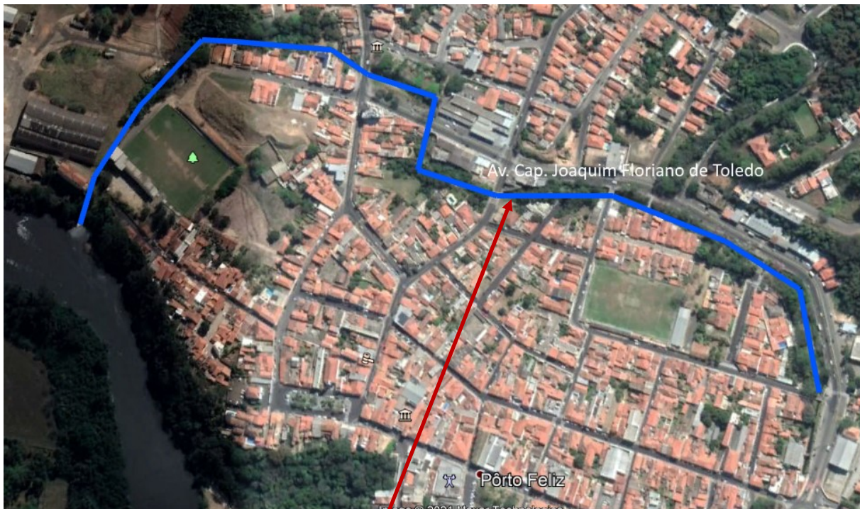
Figura - Localização do córrego Pinheirinho

Da mesma forma, dentro do núcleo urbano, em área densamente ocupada, uma vez que é margeado por duas avenidas com trânsito intenso, o Córrego Pinheirinho foi tratado com a solução de macrodrenagem clássica. A alternativa de canalização de córregos e criação de vias marginais, tornou-se prática comum na solução de problemas urbanísticos. A canalização é sempre utilizada como modo de controlar o curso do rio e as características inundáveis das margens. O rio passa a servir de meio coletor de águas pluviais, escoando-a para longe o mais rápido possível.