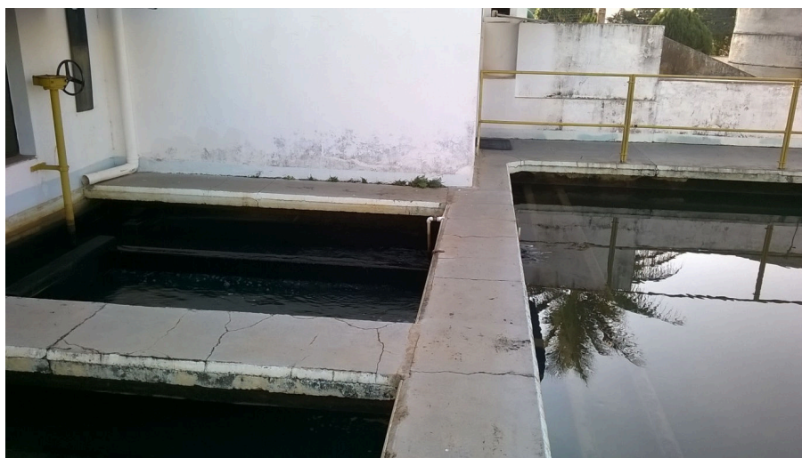
Figura 1 - Vista parcial dos filtros

Na Figura 1 é apresentada a vista parcial dos filtros.