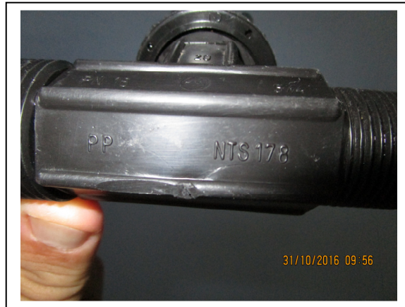
Exemplo da gravação da norma na peça

LOCAL: Pça. Dr. José Sacramento e Silva, n.º 50, Centro - Porto Feliz /SP