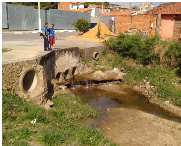
Rua Monsenhor Pires – Jardim Santa Eliza.

O Jardim Santa Eliza trata-se de uma área residencial irregular. Na Rua Monsenhor Pires há uma travessia subdimensionada, sendo que as margens do corpo hídrico apresentam assoreamento e erosão marginal. Esta área está suscetível a enchentes, inundações e alagamentos.