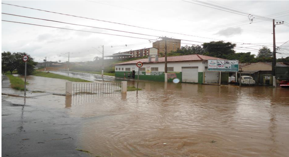
Dr. Antonio Pires de Almeida, esquina com a Rua Lício Marcondes do Amaral (2013)

Da mesma forma, dentro do núcleo urbano, em área densamente ocupada, uma vez que é margeado por duas avenidas com trânsito intenso, o Córrego Pinheirinho foi tratado com a solução de macrodrenagem clássica. A alternativa de canalização de córregos e criação de vias marginais, tornou-se prática comum na solução de problemas urbanísticos. A canalização é sempre utilizada como modo de controlar o curso do rio e as características inundáveis das margens. O rio passa a servir de meio coletor de águas pluviais, escoando-a para longe o mais rápido possível.