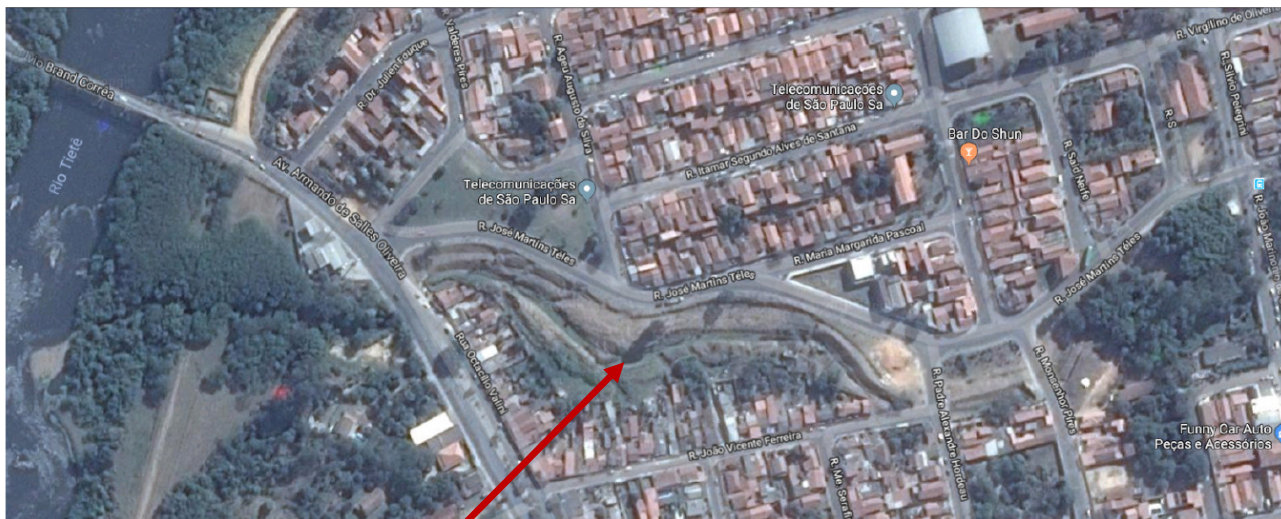
Figura - Localização do córrego Santa Eliza

Inserido no núcleo urbano, o Córrego Santa Eliza foi tratado com a solução clássica: canalização e vias de tráfego de veículos nas margens. A alternativa de canalização de córregos e criação de vias marginais, tornou se prática bastante utilizada na solução de problemas urbanísticos. A canalização é sempre utilizada como modo de controlar o curso do rio e as características inundáveis das margens. O curso d'água passa a servir de meio coletor de águas pluviais, escoando-a para longe o mais rápido possível.