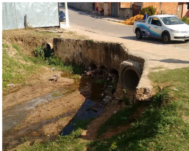
Rua Monsenhor Pires –Jardim Santa Eliza.