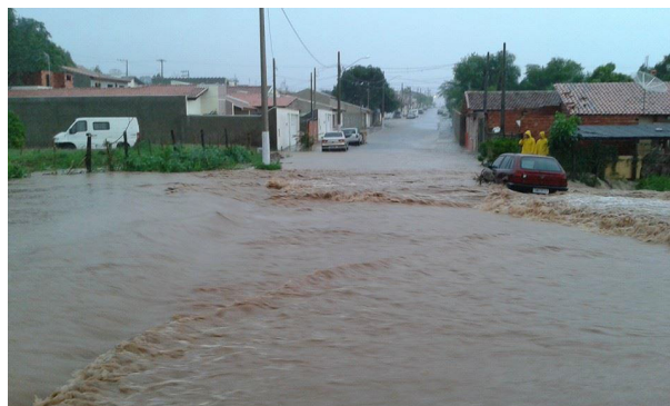
Esquina da Monsenhor Pires (out. 2014)