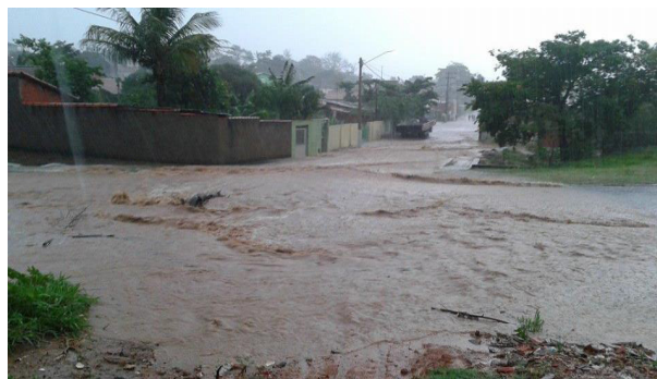
Esquina da Padre Alexandre Hordeau com a João Vicente Ferreira (out 2014)