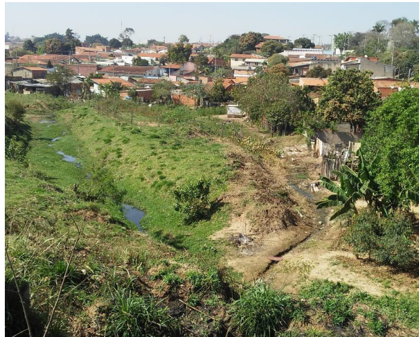
Córrego Santa Eliza – Jardim Santa Eliza.