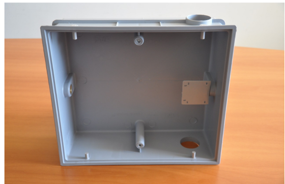
Interior da caixa