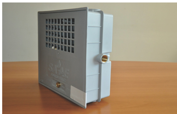
Inserto com rosca metálico ¾” nas duas laterais da caixa para recebimento da ligação de água.