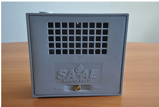
Imagem da Tampa da caixa