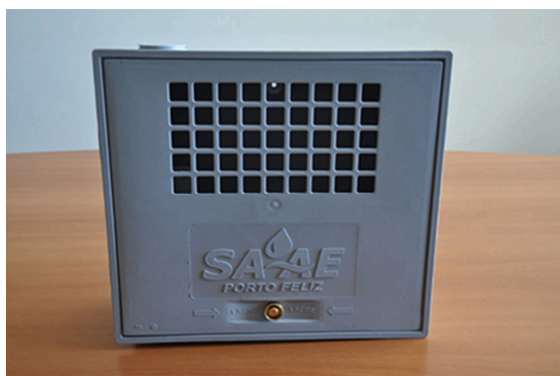
Imagem da Tampa da caixa