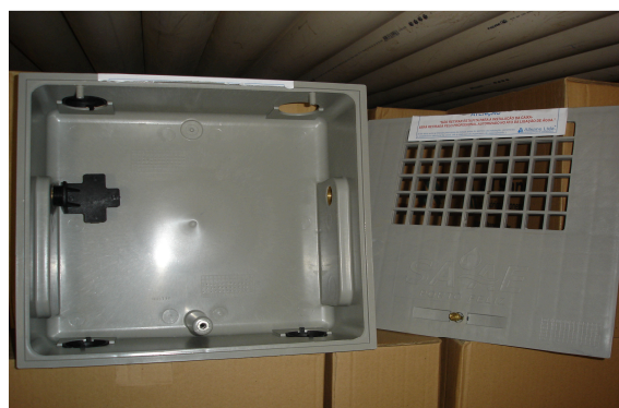
2 ou 4 furos de 1,1/2”