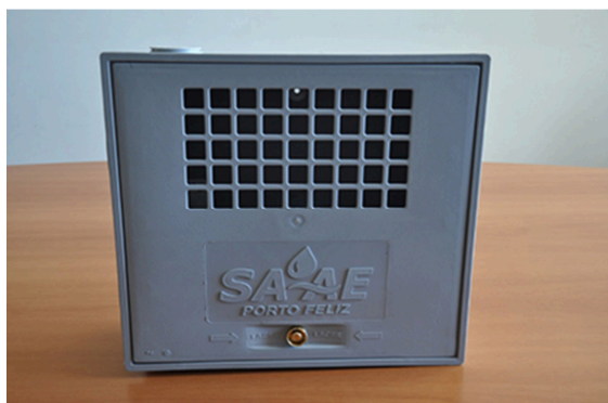
Imagem da Tampa da caixa