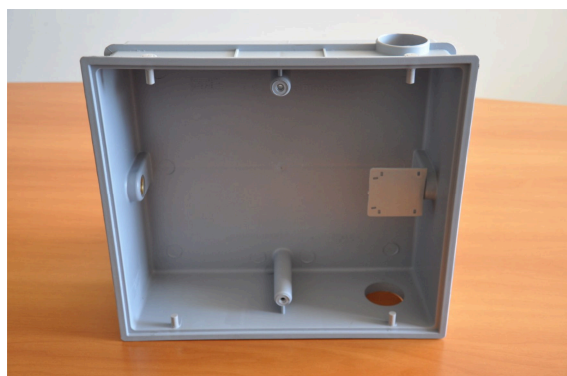
Interior da caixa