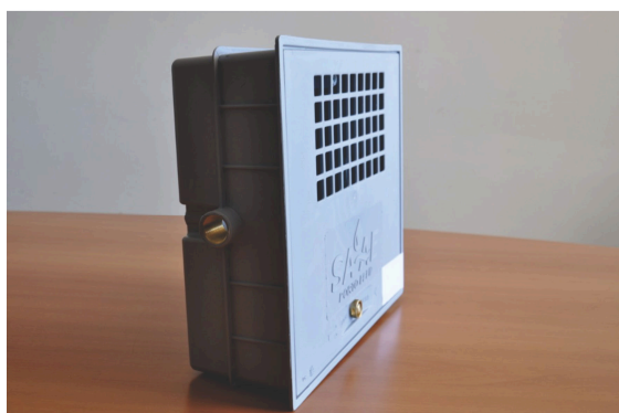
Inserto com rosca metálica 3/4” ligação de água.